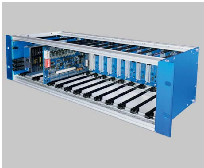
Montage in GEMOS module carrier (GMC)