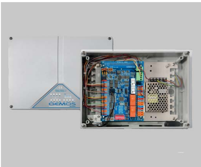
Montage in einem Aufputzgehäuse